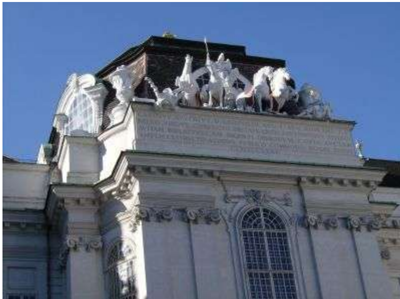
Ešte jeden pohľad na strechu