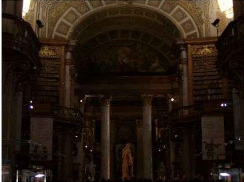
Hlavná sála historickej knižnice