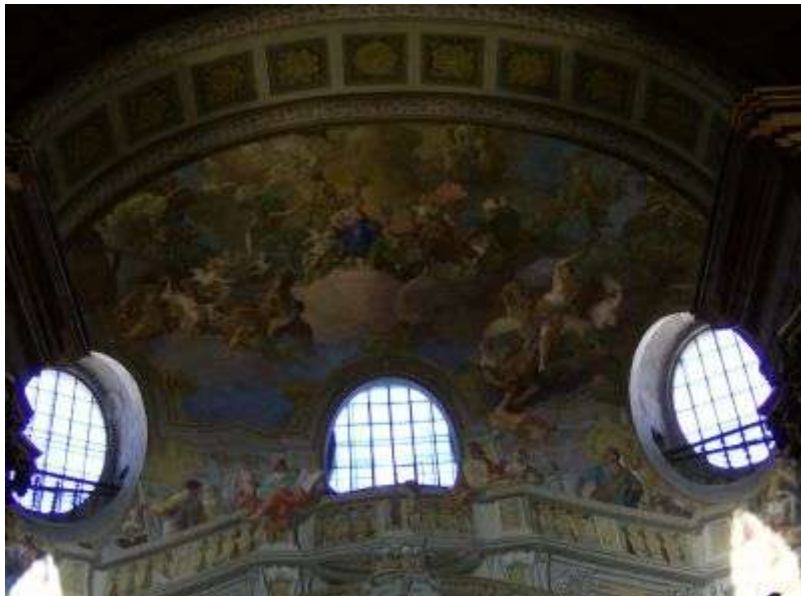
Strop knižnice s krásnymi maľbami