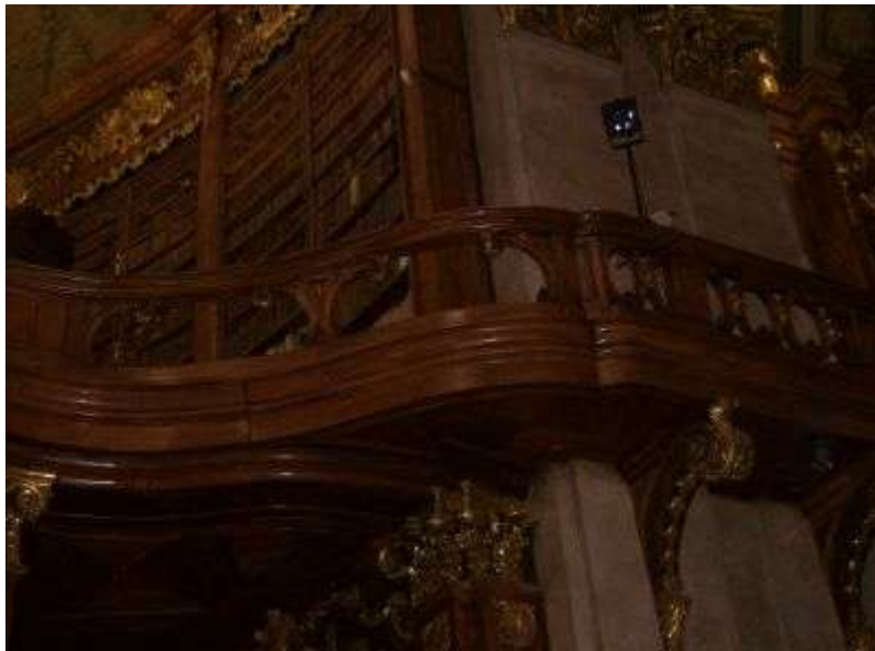
Knižnica a knihy