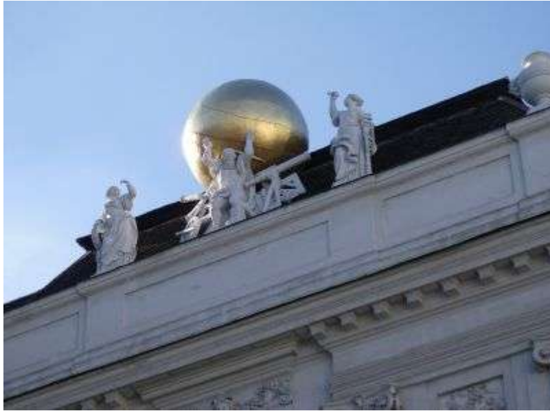
Pohľad na strechu