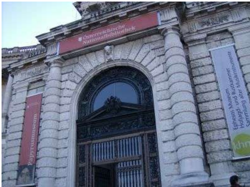
Rakúska národná knižnica vo Viedni