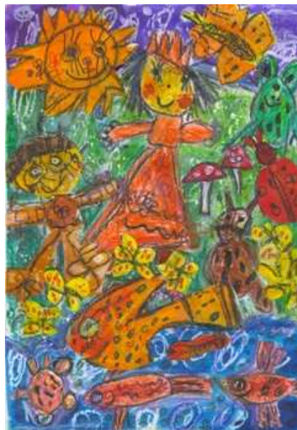
Mikulová Miroslava Skalité – Kudlov – 5 rokov Na potulkách svetom, pekná princeznička s malým Hraškom 3. miesto – Púpätka