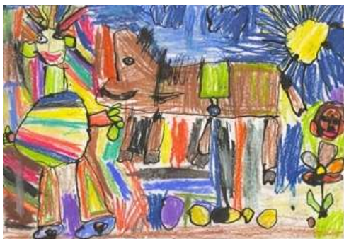
Barillová Paulinka Poprad – 5 rokov Hraško zvierá dukáty 2.miesto – Púpätka