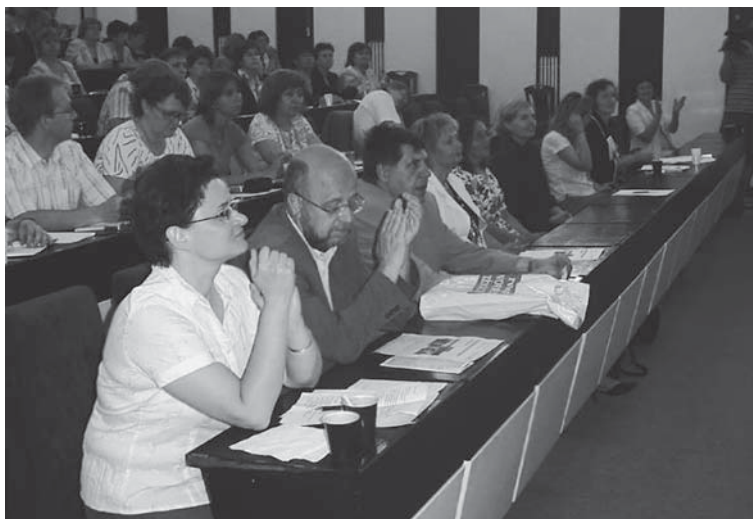
Pohľad na účastníkov celoslovenského seminára Komunitná knižnica v Podtatranskej knižnici v Poprade v júni 2008