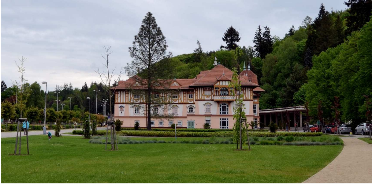
Cestou domov pri Beckove